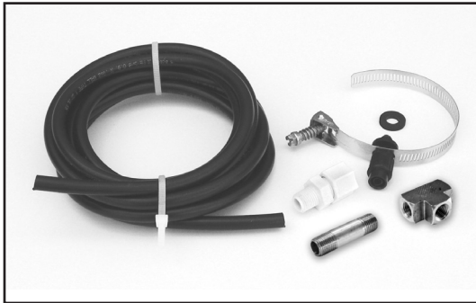
External Safety Air Bleed Kit

Sometimes the internal air bleed kit on the filter is not sufficient to handle the extra air in the system with an ozonator installed. An External Safety Air Bleed Kit (006-402-3872-00) for in-ground swimming pools is available to remove excess air from the filter and send it downstream (up to 15') past all equipment. After installing always test per instructions that air is vented from the filter when the pump is running. Filters equipped with an internal air bleed will have a backup to the external kit. You must install an external air bleed if the filter is old or does not have an internal air bleed, there is a solar system on the pool, there is a pressure side cleaner or with a booster pump.